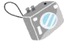
Máquina fotográfica digital