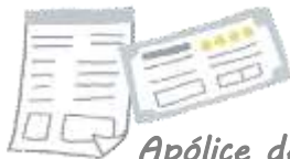
Apólice de seguro