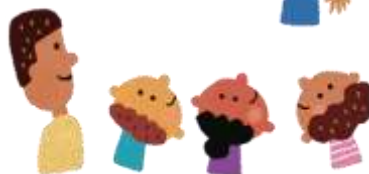
Aula de alfabetização no Vietnã