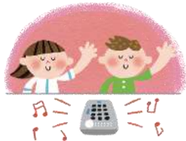
Equipamentos audiovisuais para escolas para crianças com deficiência visual ou auditiva