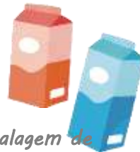
Embalagem de papel usada

* Juntar e enviar bellmark recolhidos à empresa para ganhar pontos.