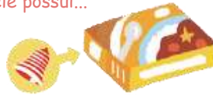
Molho de curry instantâneo

Bellmark é um pequeno símbolo com o desenho de um sino. Produtos de cerca de 50 empresas que colaboram no movimento levam o símbolo em sua embalagem.