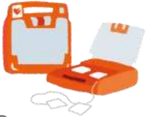
AED (desfibrilador externo automático)

➔ Dúvidas surgem quanto ao que acontece com bellmark recolhidos em casa, não é? Vamos ver como se faz o uso de bellmark recolhidos e quais são os procedimentos tomados.