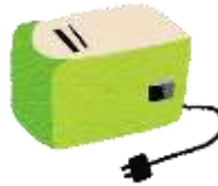
Limpador para apagador de quadro-negro