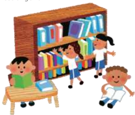
Construção de uma biblioteca em escola do Laos

Programas de apoio são realizados através de entidades de assistência que trabalham com escolas em nações em desenvolvimento, bem como são doados materiais didáticos para escolas de japoneses no estrangeiro.