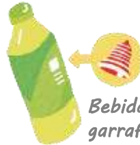
Bebida em garrafa PET