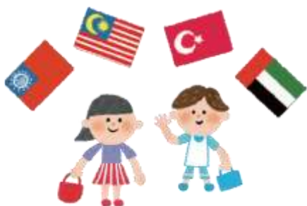
Doação de materiais e equipamentos didáticos a escola de japoneses

10% do pagamento dos produtos adquiridos vai para o fundo de ajuda mútua