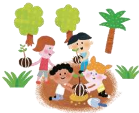
Plantação de árvores com crianças de diversos países