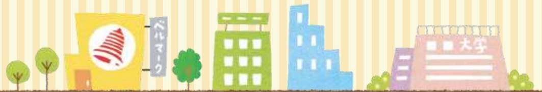
Ilustração: Chiiko Watanabe

Este livreto foi preparado com base em uma citação do site da Fundação de Apoio à Educação Bellmark na internet e sua tradução para português foi coordenada pela companhia Aioi Nissay Dowa Insurance.