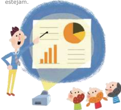
Equipamentos de ajuda educacional para escolas localizadas em áreas remotas e escolas para crianças com deficiência