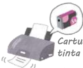
Cartucho de tinta usado