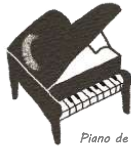
Piano de cauda

Fazem-se escolhas de materiais didáticos necessários ou equipamentos desejados, e sua aquisição é realizada junto de empresas cooperantes no movimento, com o uso do depósito Bellmark.